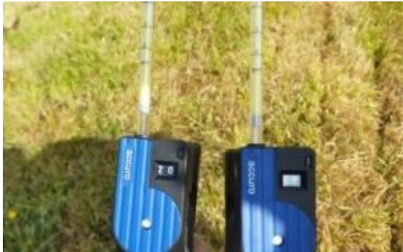
Sensibilisation à la volatilisation de l'ammoniac