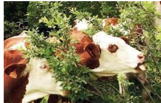
Les arbres fourragers